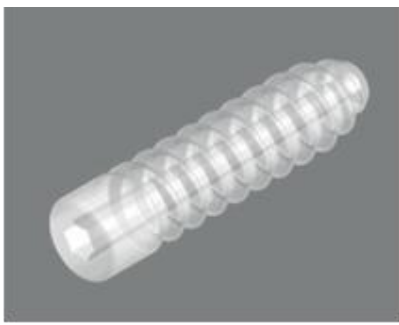
Poly ( L-D Lactide) (70/30) (70/30) + TCP